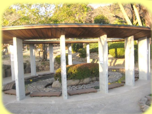
鬼石坊主地獄の足湯